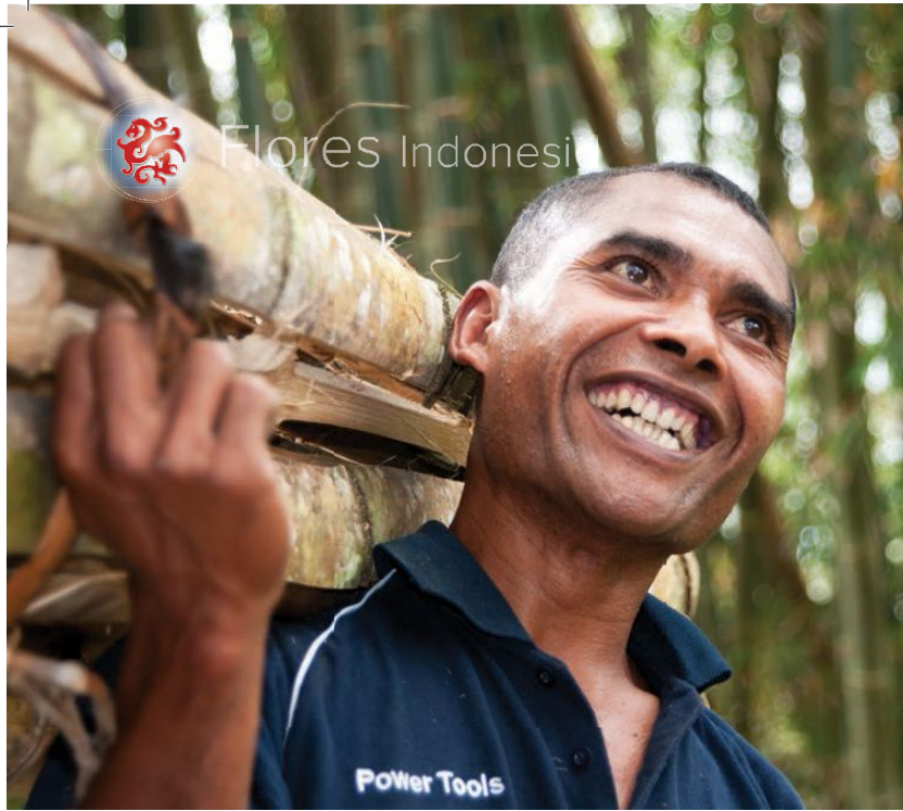
Gatsvrije en open mensen