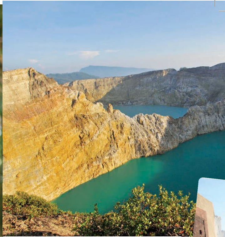
De meren van Kelimutu