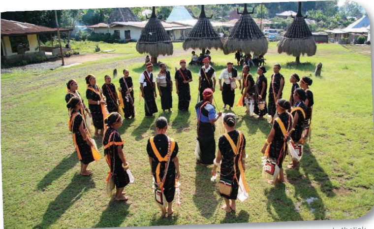
Hoewel het overgrote deel van de bewoners katholiek is, worden traditionele dansen en ceremonies nog altijd met overgave uitgevoerd