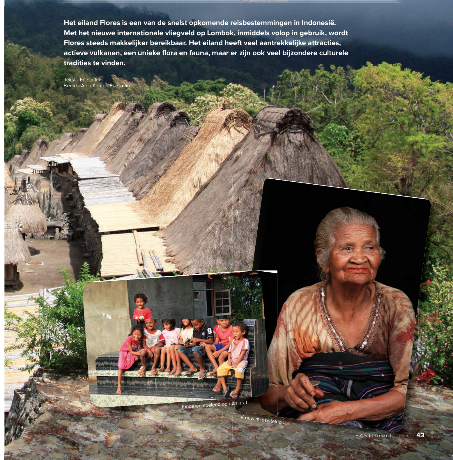
Kinderen spelend op een graf

Tekst - Ed Caffin